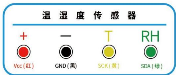
Vcc: 电源(红色); GND (黑色); SCK(黄色或者白色); SDA(绿色或者蓝色)